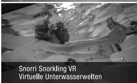
Snorri Snorkling VR Virtuelle Unterwasserwelten