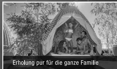
Erholung pur für die ganze Familie