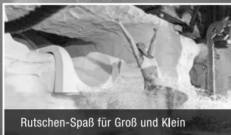
Rutschen-Spaß für Groß und Klein